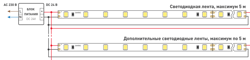
Схема 1. Подключение нескольких светодиодных лент с двух сторон