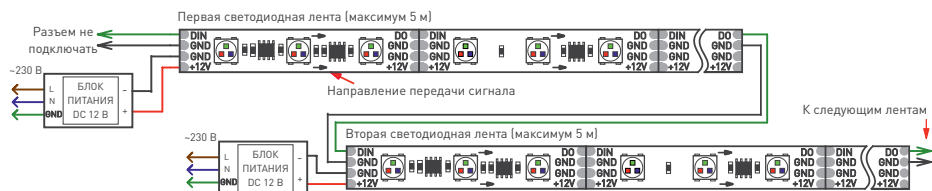
Рис. 1. Схема подключения ленты без использования внешнего контроллера (максимум 1024 пикселя, общий рисунок динамического эффекта при переходе с ленты на ленту сохраняется)