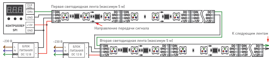
Рис. 2. Схема подключения ленты при управлении от внешнего контроллера